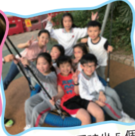
原來鞦韆可以同時坐 5 個人