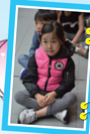
聚精會神聽導師講解