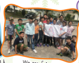
We are 「A」