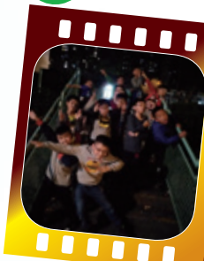
在晚間，一同完成任務

小二生活營的目的是希望能培養學生團隊精神和以正向言語及態度建立身邊的同學，學生在兩日一夜的生活營中，透過一連串團隊遊戲和集體活動來加強同學之間正向互動、建立團隊和合作精神。