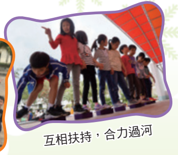
互相扶持，合力過河